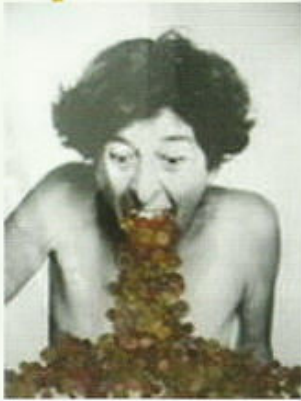
DESEOS Arteko (Donostia)